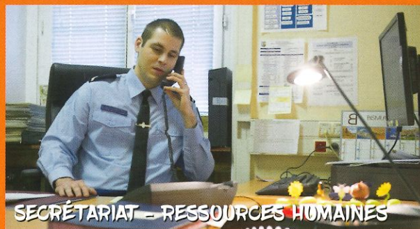
SECRETARIAT - RESSOURCES HUMAINES