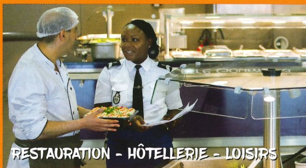
RESTAURATION - HÔTELLERIE - LOISIRS