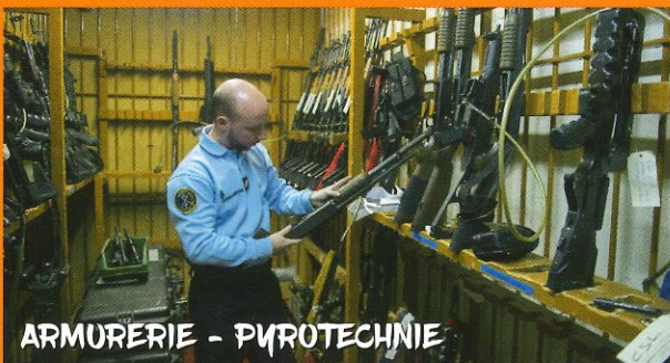
ARMURERIE - PYROTECHNIE